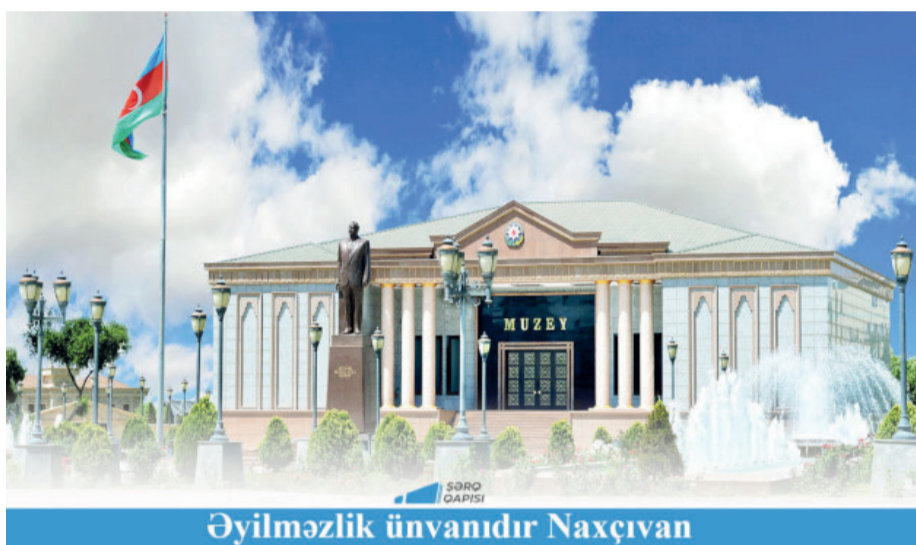
Əyilməzlik ünvanıdır Naxçıvan

sahələrdə daha yüksək nəticələr əldə etmiş qurumların illik hesabatlarını yığcam şəkildə təqdim edirik.