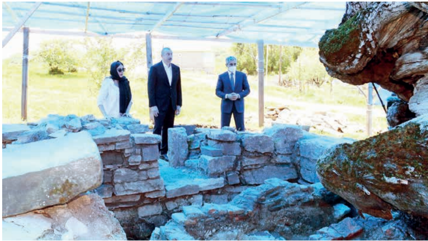
Prezident İlham Əliyev və birinci xanım Mehriban Əliyeva Pir Ömər Sultan ziyarətəhəllərində

Təəssüf ki, son 200 il ərzində Azərbaycanın da tərkibində olduğu imperiyaların siyasi və dini mərkəzləri tərəfindən bu ifrat və məkrli antiislam xətti müdafiə və təşviq olunmuşdur. Bunun nəticəsidir ki, Azərbaycanın İslam dövrü tarixinin real və dürüst mənzərəsi iki əsr ərzində necə dəyərlər pərdə arxasında qalmağa məhkum edilmişdir. Beləliklə, Orta əsr Azərbaycan dövlətlərinin tarixi, onlara məxsus mədəni irsə sanki filtirdən keçirilməklə, tam olaraq İslam düşüncəsi və dəyərlərindən təcrid olunmuş halda təqdim edilmişdir. İslamın bu məmləkətdə bəxş etdiyi və formalaşdırdığı müsbət və mütərəqqi olan milli-mənəvi və maddi dəyərlərin unudulması siyasəti yeridilmişdir. Təbii ki, belə bir qüsurlu yanaşma olduğu şəraitdə Azərbaycan tarixi və mədəniyyətinin real və dürüst tədqiqi və təqdimi mümkün olmayıb. Bütün bunların fəsadlarının Azərbaycan üçün nə dərəcədə ağır, təhlükəli və qəbuləlməz olduğunu Cənubi Qafqazda əzəli torpaqlarımız hesabına Ermənistan adlı bufer dövlət yaradılarkən, homin oyuncaq dövlət tərəfindən ölkəmizə qarşı zaman-zaman ərazi iddiaları səsləndirilərkən, çoxsaylı terror aktları törədilərkən və nəhayət, Qarabağ işğala məruz qalarkən, çox gec olsa da, artıq bütün dünya da baş verənləri görmüş və bildirmişdir. Baş verənlər, əslində, elə Azərbaycan elmi, xüsusən də tarix və arxeologiya elmləri, bu istiqamətdə fəaliyyət göstərməli olan elmi idarə və təşkilatlar üçün də bir dərəcə oldu.