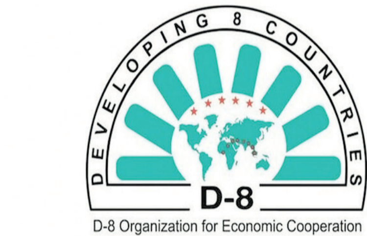
D-8 Organization for Economic Cooperation

Əlamətdar haldır ki, Mediannın İnkişafı Agentliyi media savadlılığının artırılması yönündə işlərin səmərəliliyini təmin etmək üçün xüsusi proqram və internet informasiya resursu hazırlayıb. 2023-cü ildə Agentlik tərəfindən "Medialiteracy.media.gov.az" portalı yaradılaraq istifadəyə verilib. Bu portal media savadlılığı istiqamətində məlumat almaq istəyənlər üçün mühüm töhfəyə çevrilib. Mediannın İnkişafı Agentliyi paralel olaraq "media savadlılığı haftəsi" mövzusunda kampaniyalar təşkil edir. Agentliyin media savadlılığının artırılması üzrə proqramları bu cür sistemli şəkildə təşkil etməsi vətəndaşların mövzuya marağını artırır. Fikrimcə, bu cür proqramların və kampaniyaların təşkil olunması Azərbaycanda media savadlılığının inkişaf etdirilməsinə stimullaşdırır, nəticədə ölkəmizə qarşı yönəlməmiş dezinformasiyaların ifşası edilməsinə şərait yaradır.