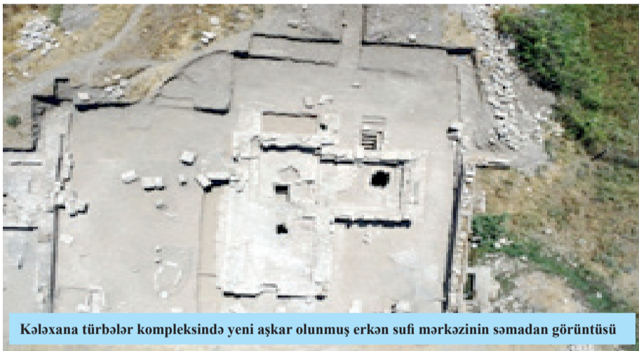
Kələxana türbələr kompleksində yeni aşkar olunmuş erkən sufi mərkəzinin sadə görünüşü

Əfsuslar olsun ki, erməni kilsəsi və ona havadarlıq edən bəzi Qərb dairələri uzun illərdir ki, davamlı olaraq Azərbaycanı da tolerantlıq mühtitindən sui-istifadə etməklə xalqımıza məxsus bir çox tarixi-mədəni dəyərləri inkar etmək, onu özününküləşdirmək siyasəti yeritmişlər.