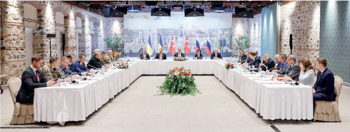
(əvvəlki 1-ci səhifədə)

Təəssüf ki, son günlər geniş və bərkətlili Ukrayna torpaqlarında cəbhənin bütün təmas xətti boyu döyüşlərin intensivliyi daha da artıb.