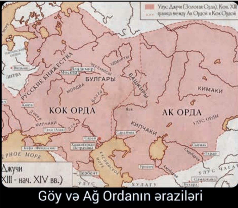
Göy və Ağ Ordanın əraziləri

Göy Orda mədəniyyəti türk-monqol ənənələrinin sintezindən formalaşmışdır. XIII–XIV əsrlərdə bu dövlət Avrasiya çöllərində güclü siyasi qüvvə olmaqla yanaşı, həm də mühüm mədəni mərkəz idi. İlk dövrlərdə Göy Orda hökmdarları şamanizm və tanrıçılıq ənənələrinə bağlı idilər. Lakin XIV əsrdə, xüsusilə Özbək xan dövründə (1313–1341) İslam rəsmi din elan edildikdən sonra bu dəyişiklik xanlığda məscid və mədrəsələrin, karvansaraların, saray komplekslərinin tikilməsinə, şəriət qanunlarının yayılmasına, ərəb əlifbasının istifadə olunmasına, Türk-islam ədəbiyyatının inkişafına güclü təsir göstərmişdir. Arxeoloji tapıntılar şəhərlərdə inkişaf etmiş memarlıq və sənətkarlıq ənənələrinin olduğunu təsdiq edir.