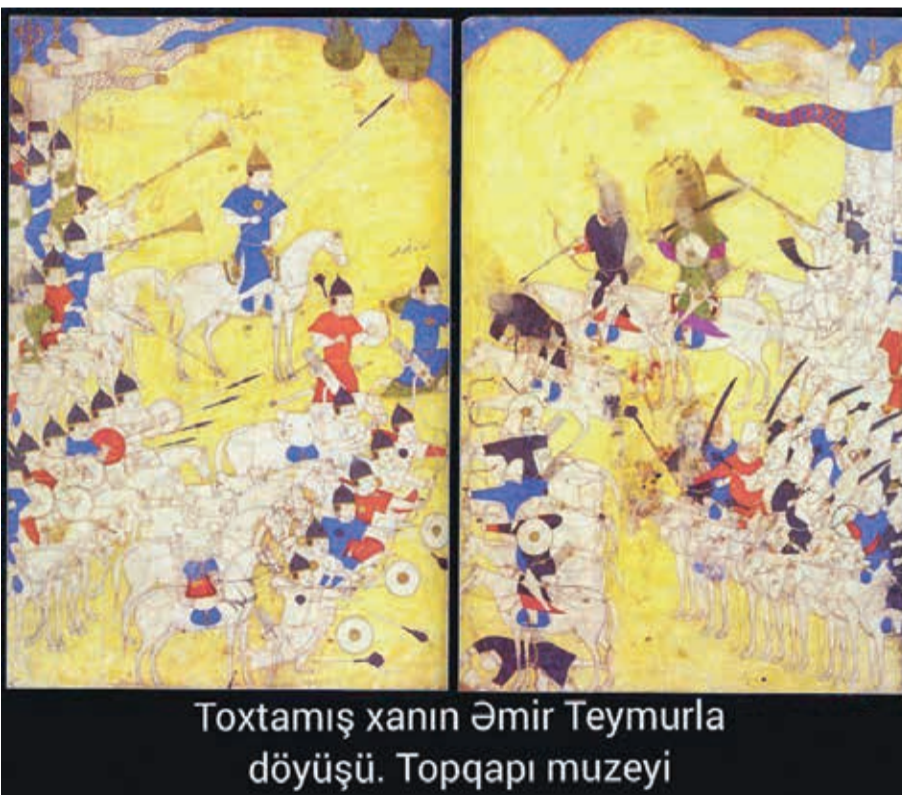
Toxtamış xanın Əmir Teymurla döyüşü. Topqarı muzeyi

İlkin mənbələr Qızıl Ordanın ərazi sistemini təsvir edərkən rəng çalarlarından istifadə edirdilər–Ağ Orda və Göy Orda. Ağ və mavi rənglər müvafiq olaraq sağ (qərb) və sol (şərqi) tərəfləri təmsil edən ənənəvi türk və monqol simvollarıdır. Ordaların rəng çalarlarına həm rus salnamələrində,