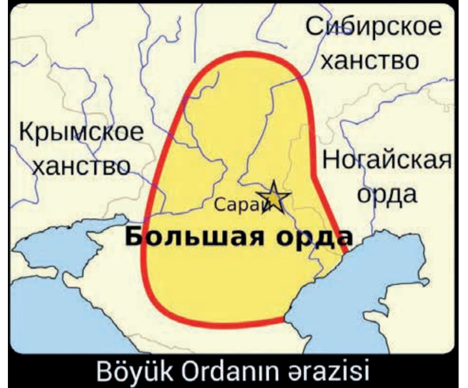
Böyük Ordanın ərazisi