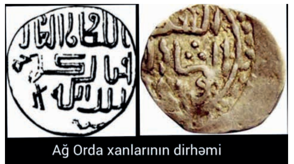
Ağ Orda xanlarının dirhəmi

1. Orda Eçen xan, Cuçinin böyük oğlu, Çingiz xanın nəvəsi, Göy Orda xanı Batı xanın böyük qardaşı. 2. Gunqıran xan, Orda Eçenin dördüncü oğlu, 1270-ci illərin sonlarından hakimiyyətdə olub. 3. Sartaktay xan. 4. Kuinci xan, Sartaktayın oğlu, Orda Eçenin nəvəsi. 5. Bayan xan, Kuincinin oğlu, Vətəndaş müharibələri illərində hökmdarlıq edib, Şərqi Dəşti-Qıpçaqda irsi hakimiyyət hüququna malik idi, diplomatik münasibətləri dəstəkləyib.