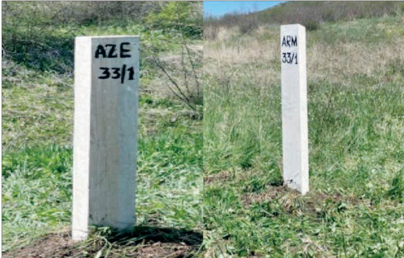
(əvvəlki 1-ci səhifədə)

Ermənistanda isə durum tam fərqlidir. Haqqında söz açdığımız ajiotaj da inam və etimad mühitinin olmamasından qaynaqlanır. Elə "Vətən naminə Tavuş" adı ilə başlanmış hərəkatın səbəbi də məhz budur. Əlbəttə, başqa siyasi səbəblər də öz yerində. Ancaq indi bilavasitə bu barədə fikir bildirməyə, daha çox Ermənistanın ictimai rəyində demarkasiya və delimitasiya prosesinə zidd təmayüllərdəki ayrı-ayrı konkret elementlərdən söz açacağıq.