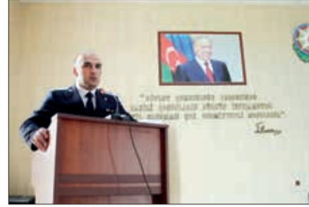
Hərbi prokurorun böyük köməkçisi – mətbuat xidmətinin rəhbəri, baş ədliyyə

Ümummilli lider Heydər Əliyevin anadan olmasının 101-ci ili və ölkəmizdə 2024-cü ilin "Yaşıl dünya naminə həmrəylik ili" elan edilməsi ilə əlaqədar Bərdə rayonunda Hərbi Prokurorluğun və DİN-in Daxili Qoşunlarının rəhbər və yüksək rütbəli hərbi qulluqçularının iştirakı ilə birgə tədbir keçirilib.