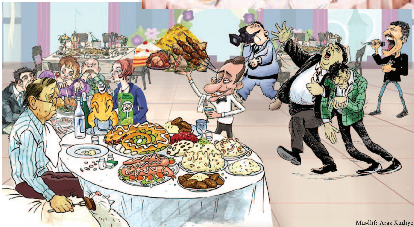
Müəllif: Araz Xudiyev