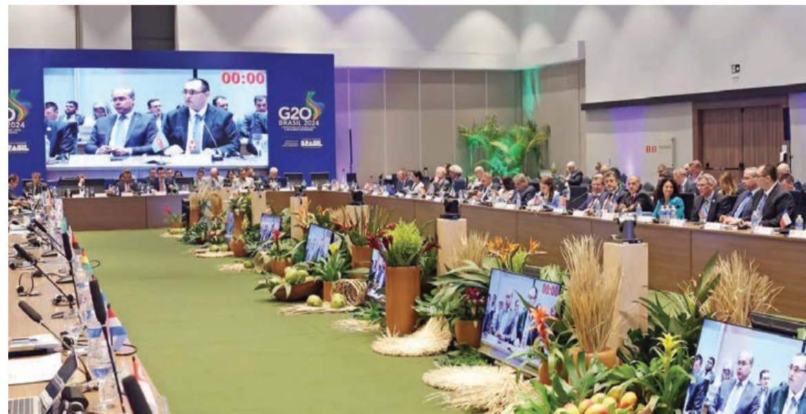
Braziliyanın Kuyaba şəhərində "Böyük iyirmiik" (G20) ölkələrinin Kənd Təsərrüfatı Nazirlərinin Toplantısı keçirilib. Tədbirdə 23 ölkədən kənd təsərrüfatı naziri iştirak edib.

Kənd Təsərrüfatı Nazirliyinin İctimaiyyətlə əlaqələr və informasiya təminatı şöbəsinə AZƏRTAC-ə bildirilib ki, beynəlxalq tədbirdə Azərbaycanı kənd təsərrüfatı naziri Məcnun Məmmədovun rəhbərlik etdiyi nümayəndə heyəti təmsil edib. Toplantıya müxtəlif ölkələrin dövlət qurumları, özəl sektor, beynəlxalq təşkilatların nümayəndələri, aqrar sahədə çalışan mütəxəssislər və ekspertlər də qatılıb.