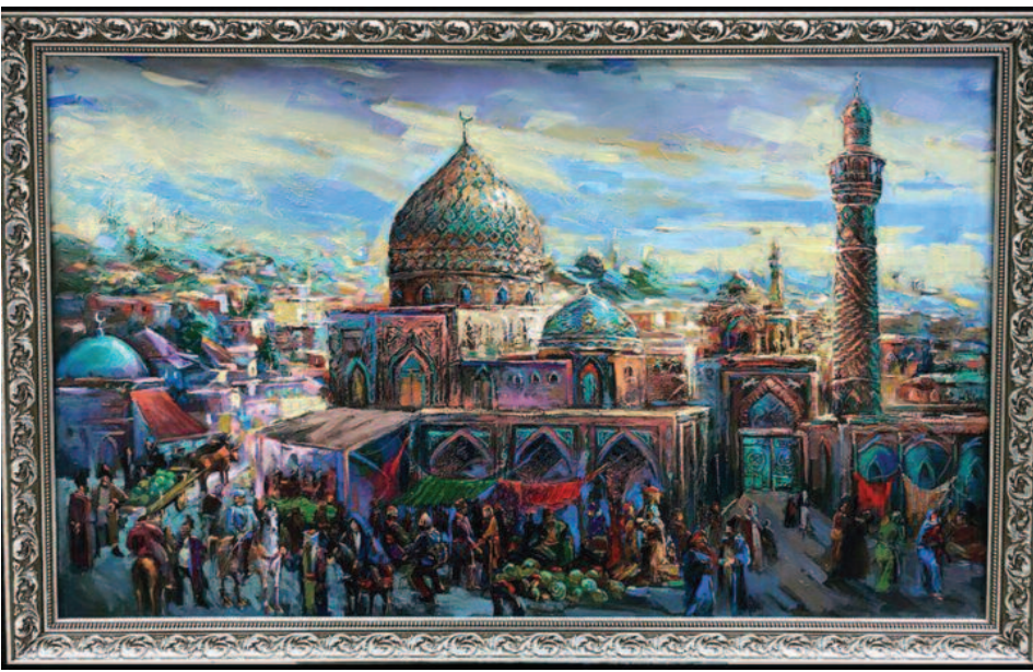
"İrəvan – qədim Azərbaycan şəhəri". Rəssamı Cavid İsmayilov

Ermənilərin yaşadığı indiki Ermənistan ən qədim dövrlərdən ulu oğuz-türk yurdunun bir bölgəsidir. Azərbaycanın bu bölgəsində də soydaşlarımız qədim mədəniyyət, zəngin ozan-aşıq sənəti, o sirdən qəhrəmanlıq və məhəbbət dastanları yaratmışlar. Bunlar da Qərbi Azərbaycanın oğuz-türk torpaqları olduğunu göstərən tarixi-coğrafi, ədəbi-mədəni qaynaqlardan biridir. Xalqımızın qəhrəmanlıq eposu "Kitabi-Dədə Qorqud" isə daha mötəbər bir mənbədir.