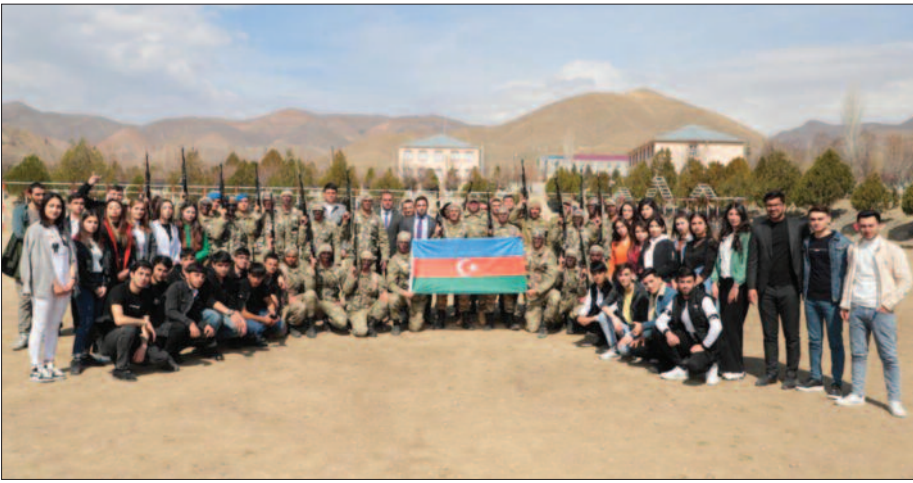
Hər bir ölkənin perspektiv inkişafı, müstəqilliyinin möhkəmləndirilməsi və dövlətçiliyinin gücləndirilməsi gənc kadrın hazırlanmasından, onların intellektual inkişafından və cəmiyyətin aparıcı üzvlərinə çevrilməsindən asılıdır.

Azərbaycanda dövlət gənclər siyasətinin əsası Ümummilli Lider Heydər Əliyev tərəfindən qoyulub. Dahi şəxsiyyət siyasi fəaliyyətinin bütün dövrlərində gənclərimizə xüsusi qayğı göstərərək onların yüksək təhsilə malik olması, milli kadr kimi formalaşması istiqamətində əməli addımlar atıb. Ümummilli Lider Heydər Əliyevin 1999-cu ildə imzaladığı "Dövlət gənclər siyasəti haqqında" müvafiq Fərman gənclərin təhsili, tərbiyəsi, sağlamlığı, intellektual və mənəvi inkişafı, asudə vaxtın təşkili problemlərinin həlli, gənclərin hüquqlarının müdafiəsi, onların respublikanın ictimai-siyasi və mədəni həyatında iştirakının təmin olunması ilə bağlı məsələlərin geniş spektrini əhatə edir. Sözügedən Fərmana uyğun olaraq ölkəmizdə "Gənclər siyasəti haqqında" ayrıca qanun qəbul edilib. Ulu Öndər Azərbaycan gəncliyinə müraciətlə demişdir: "Siz Azərbaycanın bu günü və gələcəyisiniz, sizin üzünüzdə böyük vəzifələr düşür, bu vəzifələr gələcəkdə daha da böyük olacaqdır. Siz müs-