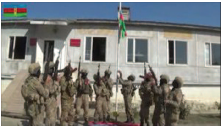
Düşmənin fərarilik, ordumuzun cəsarətlik rəmzi...

Böyük Qələbəyə aparan 44 günün 21-ci günü düşünə-düşünə xəyallar məni bir neçə ay öncəyə qaytarır: 2023-cü il martın 1-i səhər saatlarıdır. Şuşa şəhərinin içməli su təchizatı sistemlərinin tikintisindən reportaj hazırlamaq üçün səfərə çıxmışım. Zəfər yolu ilə irəliləyən avtobusun pəncərəsindən mənfur tör-töküntüsündən təmizlənən qədim, əzəli yurdumuzu qarış-qarış seyr etdikcə duyuram Qarabağın ağır-acılardan təngə gələn, həsrət, hicran bəzu bağlayan köksünün hərərətli döyüntüsünü, rahatlaşan nəfəsini, böyük ürək yanğısı, dərin sarsıntı, kəskin hiddət hissləri oyadı 30 illik çirkin niyyətlərin, naqis əməllərin misli-bərabəri tapılmayan təzahürləri... Bu mənzərələr qarşısında iki il bundan öncə, oktyabrın 17-də Füzuli rayon ictimaiyyətinin nümayəndələri ilə görüşdə ölkə Prezidentinin səsləndirdiyi fikirlər çınlayır yaddaşımda: “...Füzuli şəhəri tamamilə yerləyeksən edilib. Siz yaxşı xatırlayırsınız, Azərbaycan xalqı yaxşı xatırlayır, Füzuli azad olunandan sonra bir bina tapılmadı ki, biz oraya bayrağımızı sancaq. Bayrağımız hərbi hissənin həyatında dirəkdə qaldırılmışdı. Buraya gələn hər bir insan erməni vəhşiliyini, erməni vandallığını görür və bunu artıq heç kim inkar edə bilməz...”