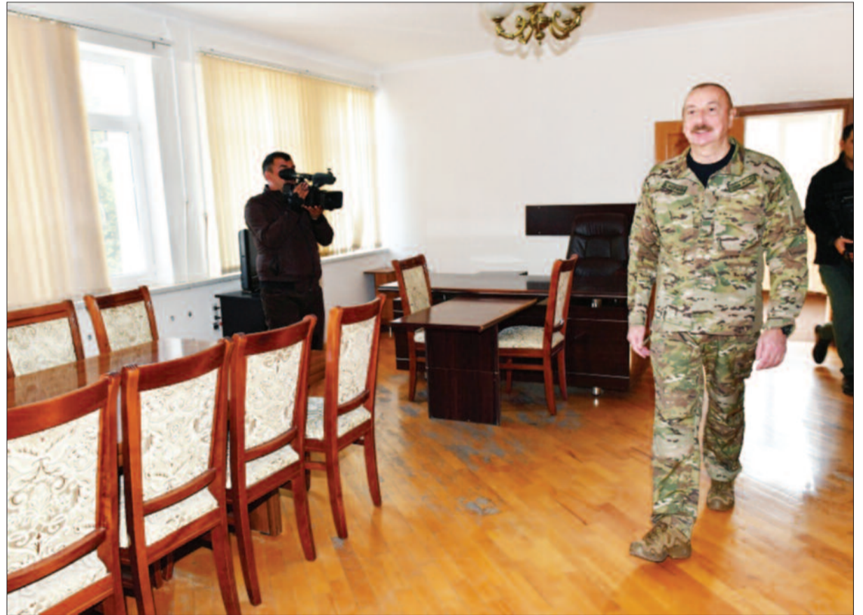
Azərbaycan Respublikasının Prezidenti İlham Əliyev oktyabrın 15-də Xocalı rayonunun Əsgəran qəsəbəsində Azərbaycan Respublikasının Dövlət Bayrağını ucaldıb.

Xocalı şəhəri 2023-cü il sentyabrın 19-20-də Azərbaycan Ordusunun Qarabağda keçirdiyi lokal xarakterli antiterror tədbirləri nəticəsində separatçılardan təmizlənib. Bu şəhərdə Azərbaycan Bayrağının dalğalanması Xocalı faciəsi qurbanlarının qanının yerdə qalmadığını bir daha nümayiş etdirir.