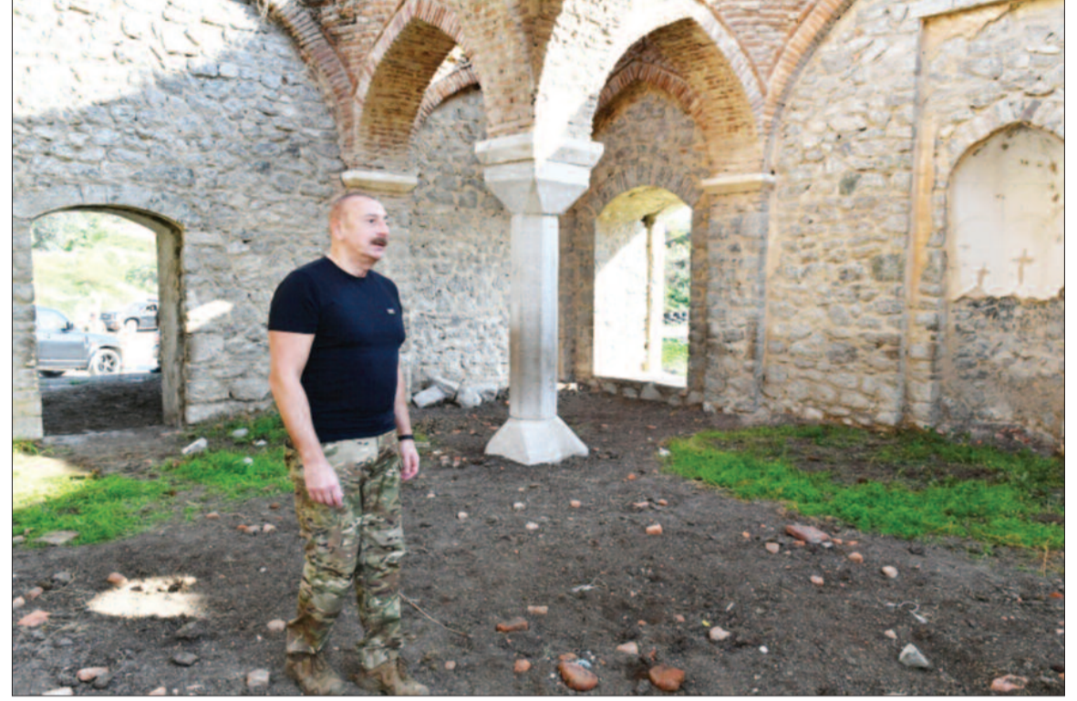
Azərbaycan Respublikasının Prezidenti İlham Əliyev oktyabrın 15-də Şuşa rayonunun Malıbəyli kəndində olub.

Qeyd edək ki, qəsəbə 1991-ci il dekabrın 28-də Ermənistan silahlı qüvvələri tərəfindən işğal olunub. Bu il sentyabrın 19-20-də Qarabağda həyata keçirilən lokal xarakterli antiterror tədbirlərindən sonra Azərbaycan Ordusu Karkicahan qəsəbəsini separatçılardan azad edib.