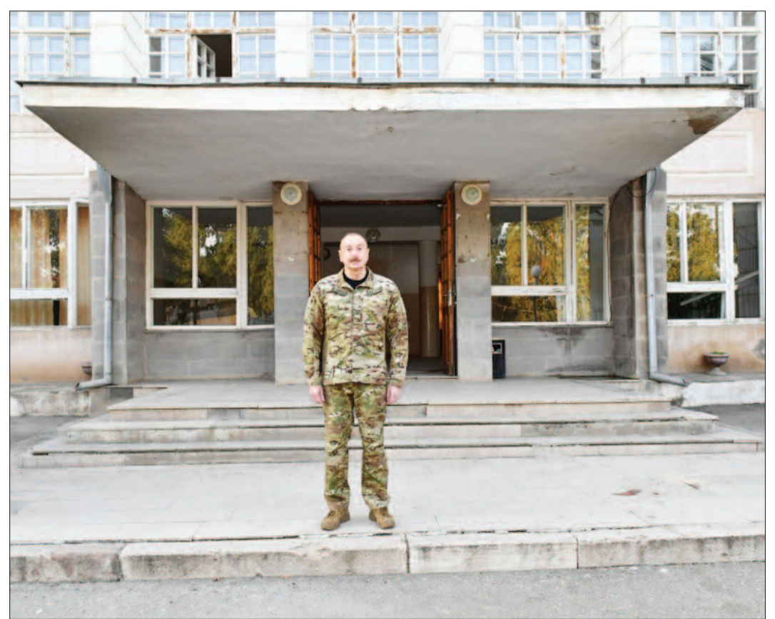
Azərbaycan Respublikasının Prezidenti İlham Əliyev oktyabrın 15-də Xocavənd şəhərində Azərbaycan Respublikasının Dövlət Bayrağını ucaldıb.

Bu il sentyabrın 19-20-də Azərbaycan Ordusunun Qarabağda həyata keçirdiyi lokal xarakterli antiterror tədbirlərindən sonra Əsgəran qalası separatçılardan azad edilib.