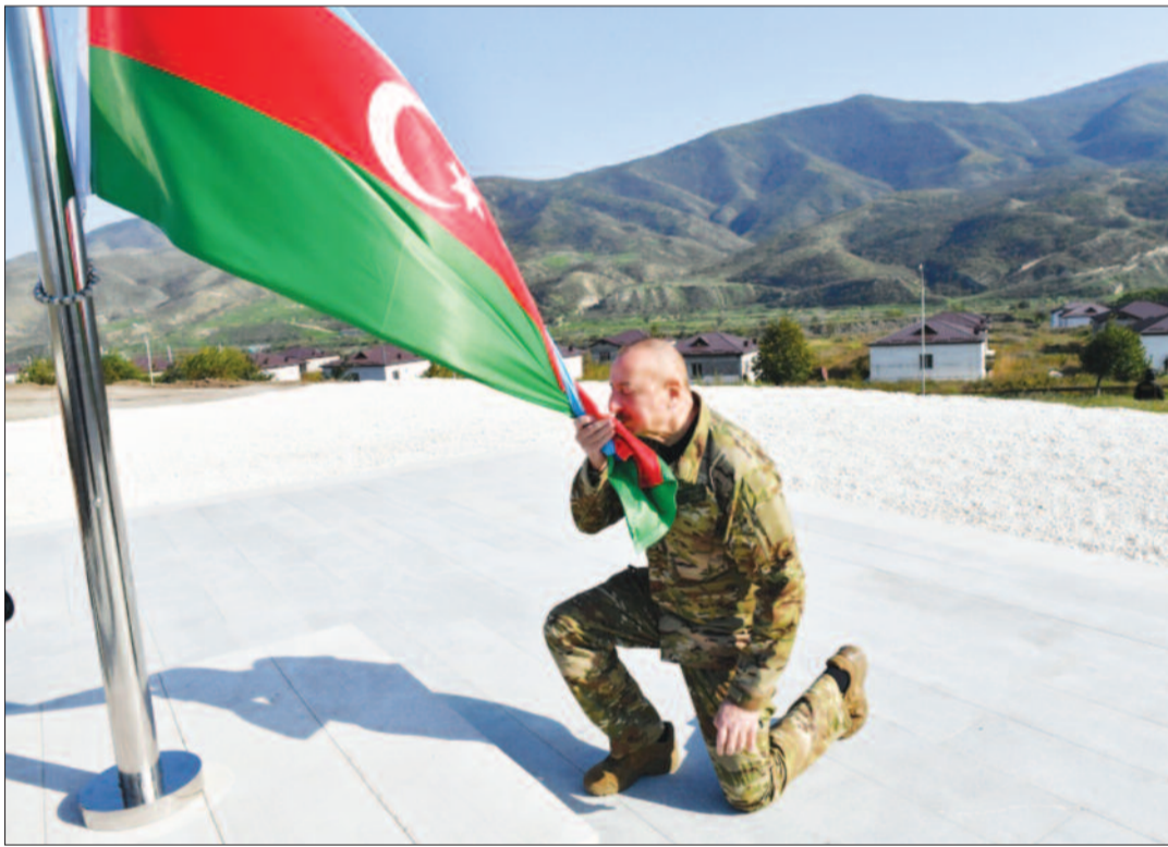
Azərbaycan Respublikasının Prezidenti İlham Əliyev oktyabrın 15-də Xocalı şəhərində Azərbaycan Respublikasının Dövlət Bayrağını ucaldıb.

Xatırladaq ki, Malıbəyli kəndi 1992-ci il fevralın 11-də Ermənistan silahlı qüvvələri tərəfindən işğal edilib. Kənd 2023-cü il sentyabrın 19-20-də Azərbaycan Ordusunun Qarabağda həyata keçirdiyi lokal xarakterli antiterror tədbirlərindən sonra separatçılardan təmizlənib.