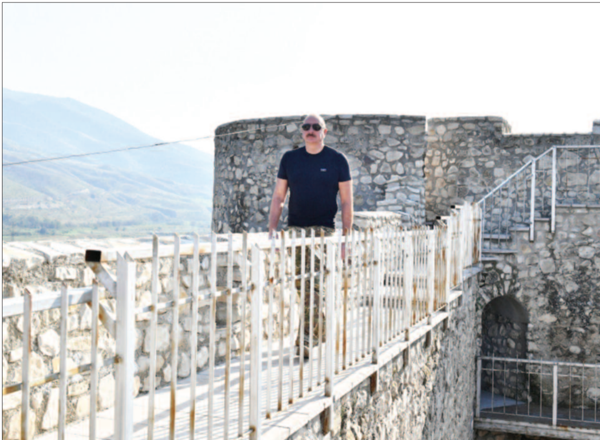
Azərbaycan Respublikasının Prezidenti İlham Əliyev oktyabrın 15-də Əsgəran qalasında olub. Dövlətimizin başçısı Əsgəran qalasına və əraziyə baxış keçirdi.

Qəsəbə 2023-cü il sentyabrın 19-20-də Azərbaycan Ordusunun Qarabağda həyata keçirdiyi lokal xarakterli antiterror tədbirləri nəticəsində separatçılardan təmizlənib.