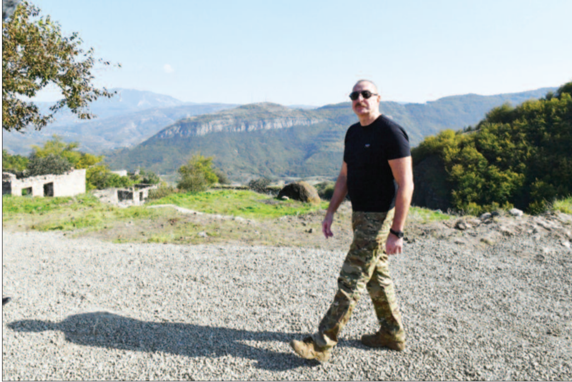
Azərbaycan Respublikasının Prezidenti İlham Əliyev oktyabrın 15-də Xankəndi şəhərinin Karkicahan qəsəbəsində olub.