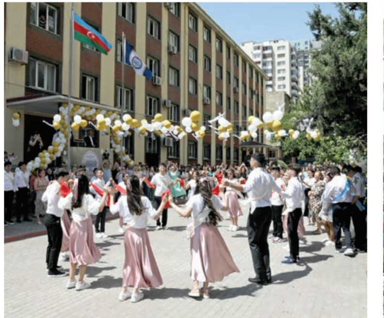
Bakıda son zəng