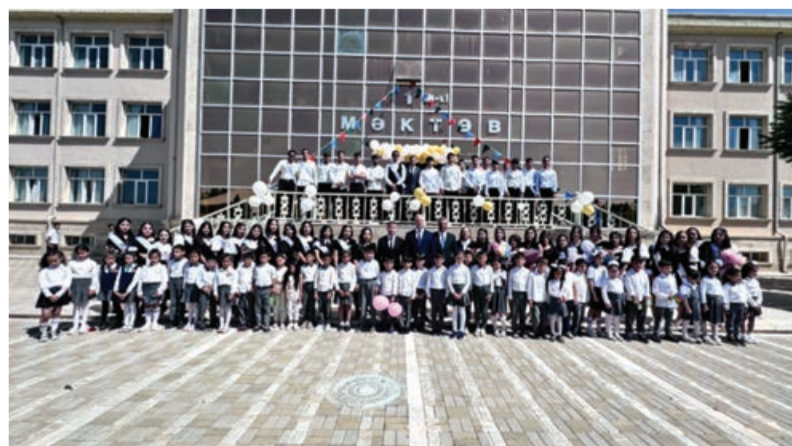
Naxçıvanda son zəng