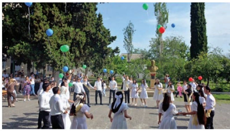
Tərtərdə son zəng