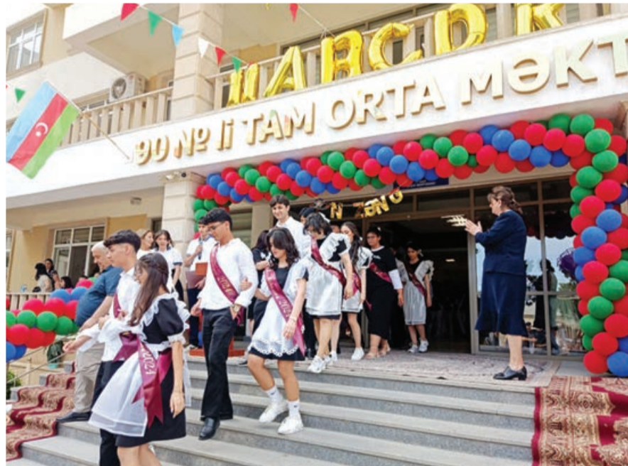
Bakıda son zəng