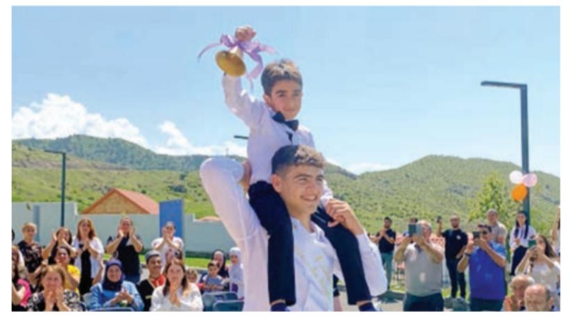
Zabuxda son zəng