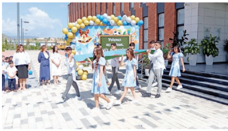
Füzulidə son zəng