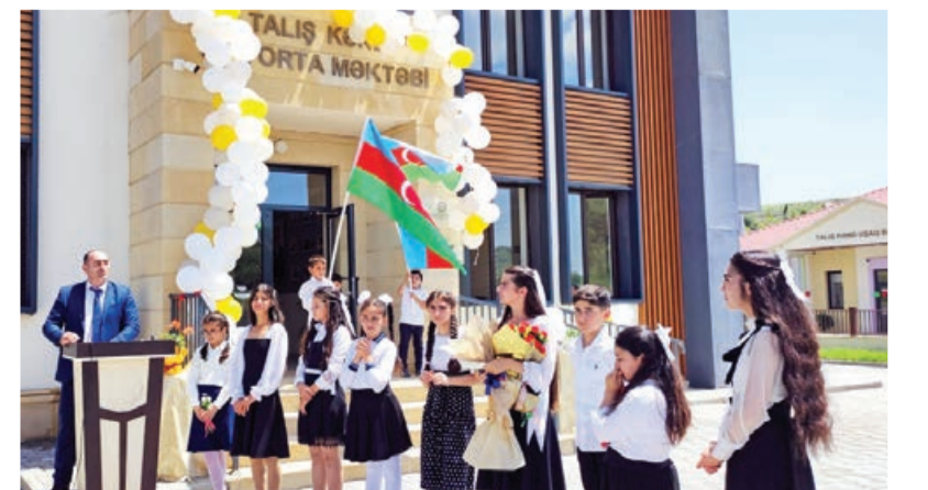
Talış kəndində son zəng