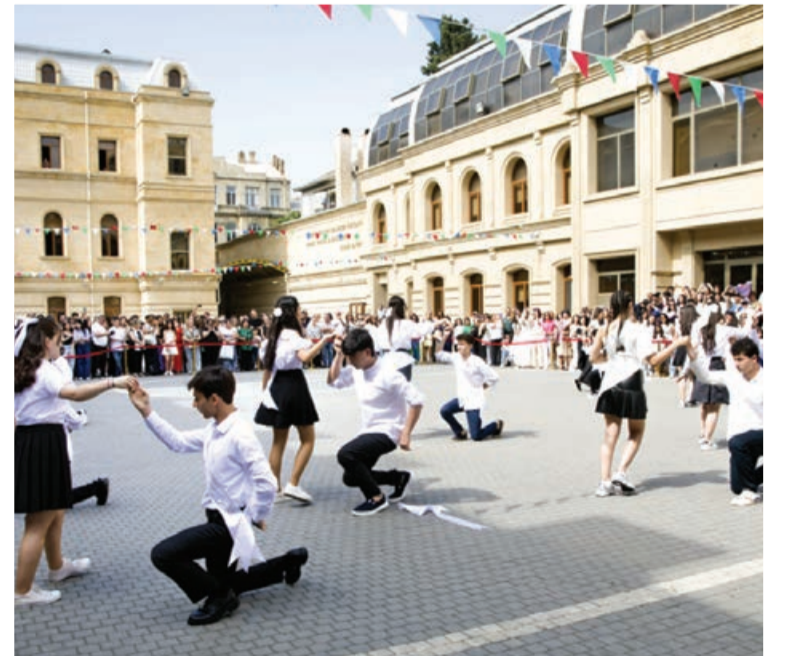
Talış kəndində son zəng