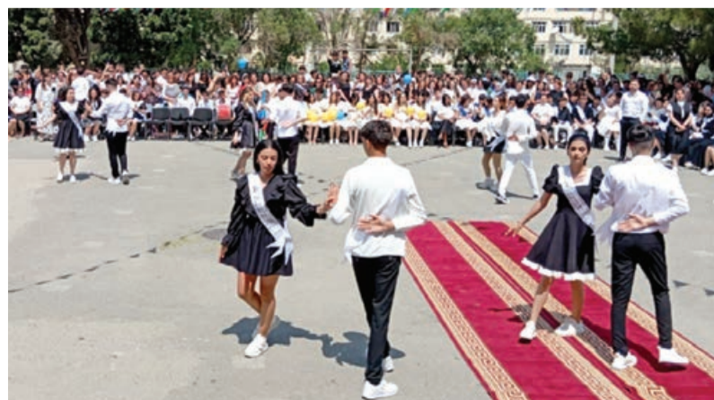
Sumqayıtda son zəng