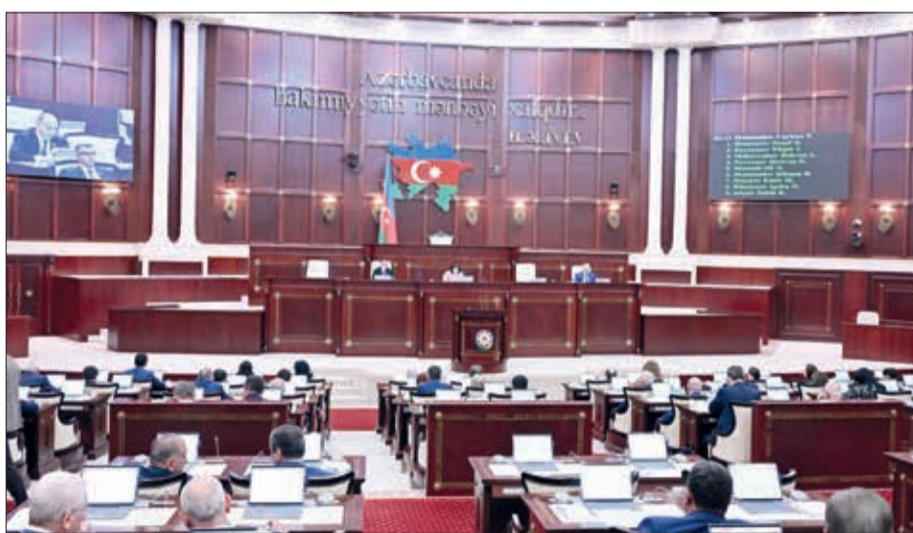
İyunun 14-də Milli Məclisin növbədənəkar sessiyasının növbəti iclası keçirildi. İclasda əvvəlcə cari məsələlər müzakirə olundu.