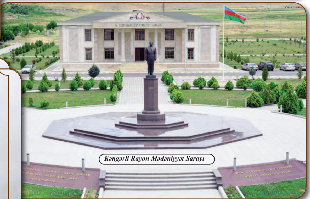
Kəngərli Rayon Mədəniyyət Sarayı