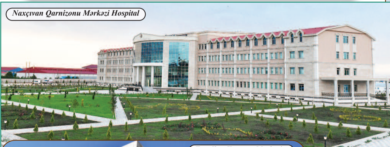
Naxçıvan Qarnizonu Mərkəzi Hospital