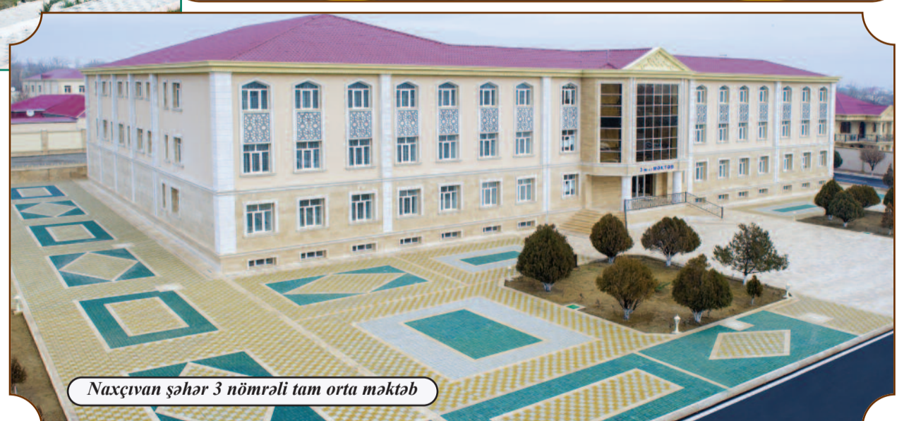
Naxçıvan şəhər 3 nömrəli tam orta məktəb