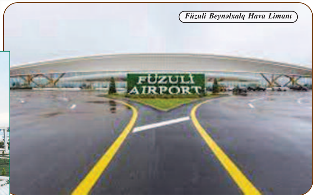
Füzuli Beynəlxalq Hava Limanı