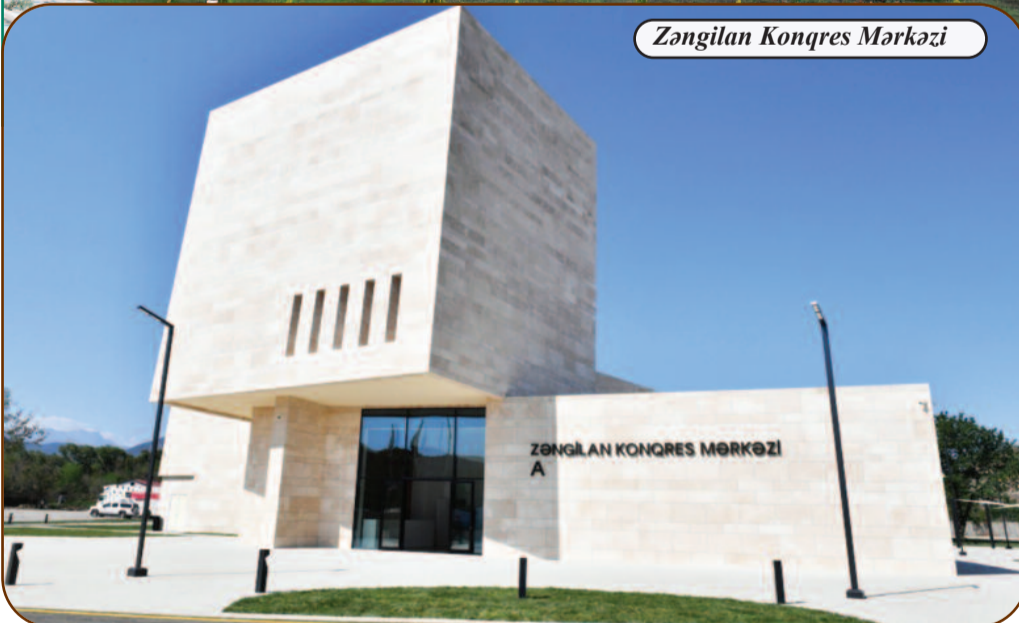
Zəngilan Konqres Mərkəzi