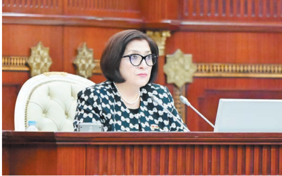
Əvvəl 1-ci sahə.

Konfrans çərçivəsində Türkiyə, Pakistan, Qazaxıstan, Tacikistan parlamentlərinin təmsilçiləri ilə ikitərəfli görüşlər də keçirildi.