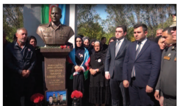
Şərur rayonunun Şəhidlər xiyabanında keçirilən tədbirdə əvvəlcə şəhidlərimizin xatirəsi birdəqiqəlik sükutla yad edilib, Dövlət

İsmayıl HACIYEV AMEA Naxçıvan Bölməsinin sədri, akademik