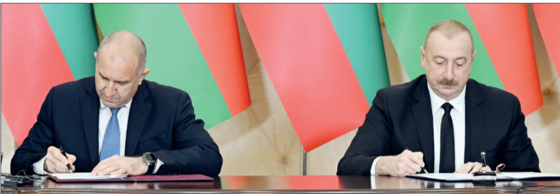
Mayın 8-də Azərbaycan Respublikasının Prezidenti İlham Əliyevin və Bolqarıstan Respublikasının Prezidenti Rumen Radevin iştirakı ilə Azərbaycan–Bolqarıstan sənədlərinin imzalanması mərasimi olub.

Azərbaycan Respublikasının Prezidenti İlham Əliyev və Bolqarıstan Respublikasının Prezidenti Rumen Radev "Azərbaycan Respublikası ilə Bolqarıstan Respublikası arasında strateji tərəfdaşlığın gücləndirilməsi haqqında Birgə Bəyannamə"ni imzaladılar.