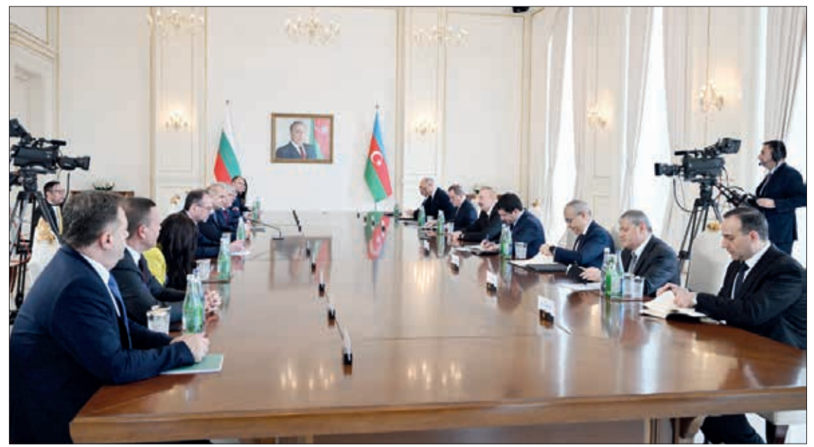
Mayın 8-də Azərbaycan Respublikasının Prezidenti İlham Əliyevin Bolqarıstan Respublikasının Prezidenti Rumen Radev ilə geniş tərkibdə görüşü keçirilib.

Görüşdə çıxış edən Prezident İlham Əliyev dedi: