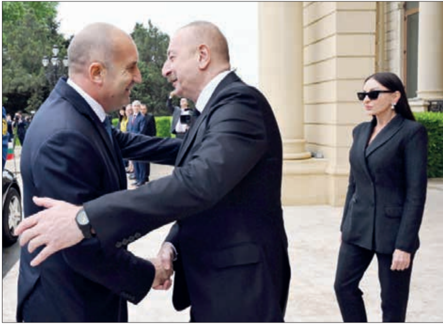
Azərbaycan Respublikasına rəsmi səfərə gələn Bolqarıstan Respublikasının Prezidenti Rumen Radevin mayın 8-də rəsmi qarşılama mərasimi olub.

Hər iki ölkənin Dövlət bayraqlarının dalğalandığı meydanda Bolqarıstan Prezidentinin şərəfinə fəxri qarovul dəstəsi düzülüb.