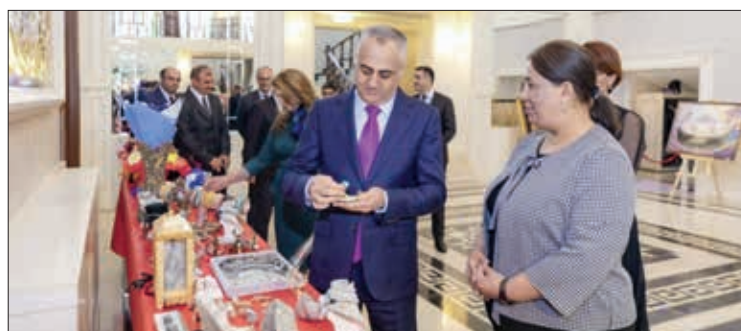
Dünən Naxçivanda 8 Mart Beynəlxalq Qadınlar Günü münasibətilə tənənəli toplantı keçirilib.

Muxtar Respublika Ailə, Qadın və Uşaq Problemləri üzrə Dövlət Komitəsinin təşkil etdiyi mərasimin əvvəlində Azərbaycan Respublikası Prezidentinin səlahiyyətli nümayəndəsi Fuad Nəcəfli və iştirakçılar istedadlı qadınların rəsm və əl işlərində, ailə təsərrüfatı məhsullarından, eləcə də qadın müəlliflərin kitablarından ibarət sərğiyə baxıblar.