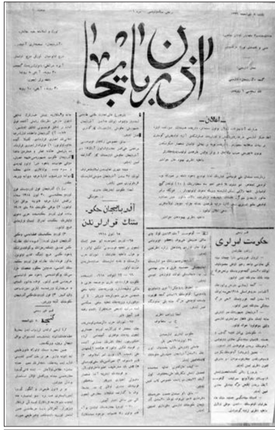
№ 1, 15 sentyabr 1918-ci il

Yalnız 1991-ci il yanvarın 1-dən etibarən Azərbaycan SSR Ali Sovetinin rəsmi mətbu orqanı "Həyat" qəzeti kimi fəaliyyətə başladı. "Həyat" qəzetinin 440 nömrəsi işıq üzü görüb. 22 sentyabr 1992-ci il tarixdə qəzetin bu status-da son nömrəsi buraxılıb. Bir məsələni də qeyd edək ki, hələ sovet hakimiyyətinin ləğvindən bir dövrə Azərbaycan Qarabağ Xalq Yardım Komitəsi yaradılmışdı. Komitənin mətbu nəşri kimi "Azərbaycan" adı altında 1989-cu ildən yeni qəzet çıxmağa başlamışdı. 156 nömrəsi işıq