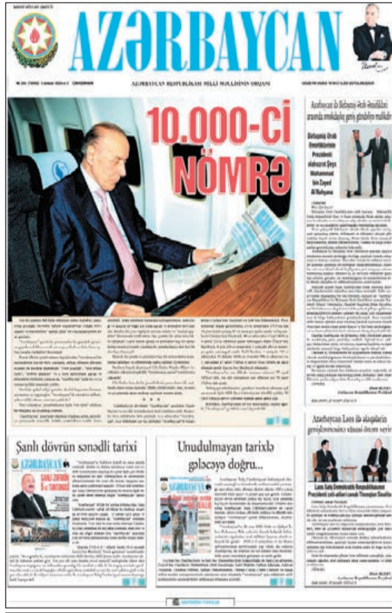
№ 10000, 3 dekabr 2025-ci il

üzü görmüş bu qəzetin son, yəni 156-cı nömrəsi 10 sentyabr 1992-ci ildə dərc olunmuşdu.