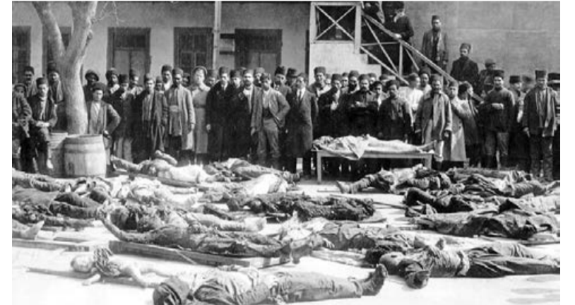
Əhalinin bir hissəsi İran və Azərbaycanın digər bölgələrinə qaçmağa məcbur oldu. Bölgədə məscidlər dağıdıldı, evlər yandırıldı və minlərlə insan həyatını itirdi.

Unutmamaq həm ədalət, həm də insanlıq borcumuzdur