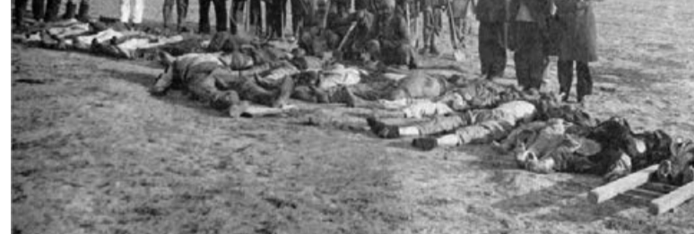
Həmin günlərdə Şamaxıda erməni daşnak qüvvələri 7 mindən çox dinc azərbaycanlı qətlə yetirdilər. Şamaxı Azərbaycanın ən qədim şəhərlərindən olmaqla, həmin dövrdə əsas mədəni və iqtisadi mərkəzlərindən sayılırdı. Burada azərbaycanlıların əhalinin əsas hissəsini təşkil edirdilər, amma şəhərdə az sayda digər xalqların nümayəndələri də yaşayırdı. Soyqırımı günlərində Şamaxıda qətlə yetirilənlər arasında xeyli sayda qadın, uşaq və yaşlı adamlar da vardı. İnsanlar evlərində diri-diri yandırılırdı, süngü ilə bədənələri deşilirdi, müxtəlif işgəncələrə məruz qalırdılar. Həmin günlərdə daşnak-bolşeviklərin ölündən qaçıb canını qurtarmaq üçün şəhərin ən qədim abidələrindən biri - Şamaxı Cümə Məscidinə yüzlərlə insan sığınmışdı. Ermənilər məscidi mühasirəyə alaraq müqəddəs məkanı içərişindəki insanlarla birlikdə yandırmışdılar. Məscid tamamilə dağıdılmış və tarixi-mədəni irsə ağır zərər vermişdi.

Martın 30-dan Bakıda başlanan soyqırımları qısa müddətdə digər bölgələrimizə də yayıldı. Aprel ayında Şamaxı, Quba, Qarabağ, Zəngəzur, Naxçıvan, Lənkəran və digər ərazilərdə azərbaycanlılara qarşı kütləvi soyqırımları eyni dəhşətlə, hətta daha ağılaşmaz şəkildə davam etdirilirdi.